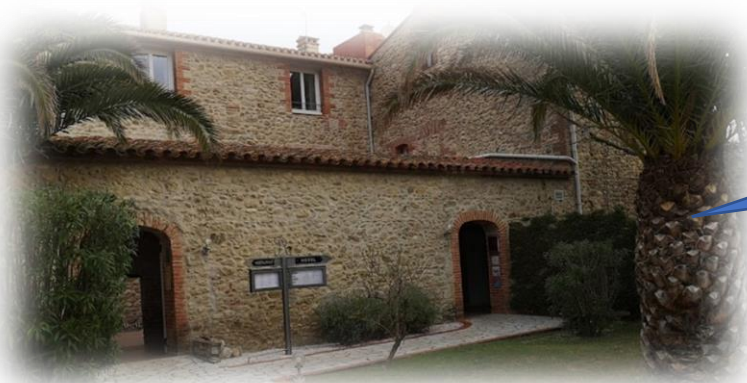
Hotel Auberge du Roua